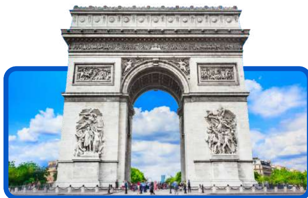
Arco do triunfo

Hospedagem e café da manhã. Pela manhã, visita panorâmica na Cidade Luz para admirar seus monumentos mais importantes, como a Place de la Concorde, o Arco do Triunfo, Champs-Élysées, a Île de la Cité com a imponente Catedral de Notre Dame, o Hôtel des Invalides, onde se encontra o túmulo de Napoleão, com breve parada no campo de Marte para fotografar a Torre Eiffel. Para o período da tarde recomendamos uma excursão opcional ao magnífico Palácio de Versalhes, declarado Patrimônio da Humanidade, para conhecer sua imponente arquitetura e seus belos jardins. À noite, como opcional, você pode assistir a um dos famosos shows, Paris Latin ou Lido.