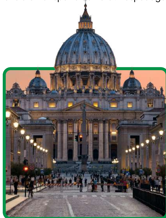
Basílica de São Pedro

Hospedagem e café da manhã. No início da manhã faremos nossa visita panorâmica à Roma Imperial com os Fóruns Imperiais, Coliseu, Arco de Constantino, Termas de Caracalla, Circus Maximus e o Vaticano. No restante da manhã você pode visitar opcionalmente os famosos Museus Vaticanos, a Capela Sistina com os afrescos de Michelangelo e o interior da Basílica de São Pedro - com nossas reservas exclusivas você vai ganhar tempo ao evitar as longas filas para entrar. À tarde, você pode fazer uma visita opcional para conhecer a Roma barroca, com suas famosas fontes, praças e palácios papais, a partir dos quais os Estados Pontifícios eram governados.