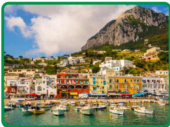
ilha de Capri