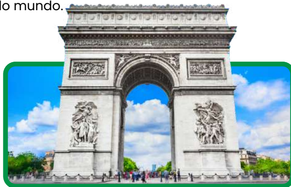
Arco do triunfo

Hospedagem e café da manhã. Dia livre para atividades pessoais. Pela manhã, recomendamos uma excursão opcional visitando o bairro de Montmartre ou o Quartier Latin (bairro latino) e um cruzeiro no rio Sena, ou uma excursão opcional de dia inteiro à cidade de Bruges, na Bélgica, onde você irá desfrutar de um cruzeiro ao longo dos canais desta romântica cidade. Além disso, pode aproveitar uma visita opcional na Disney de Paris.