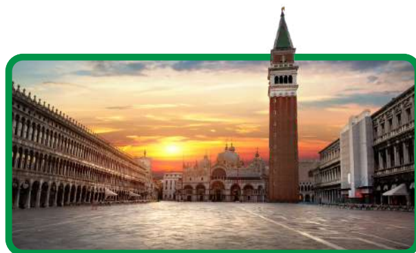
Piazza San Marco

Café da manhã. Saída para a bela cidade de Veneza. Chegaremos ao Tronchetto para embarcar em direção à Piazza San Marco, onde terá início nossa visita panorâmica a pé nesta cidade singular construída sobre 118 ilhas repletas de pontes e canais românticos. Você vai admirar a magnífica fachada da Basílica de São Marcos, seu Campanário, o Palácio Ducal, a famosa Ponte dos Suspiros. Após, tempo livre. Possibilidade de fazer um passeio opcional de gôndola ao longo dos canais e uma navegação exclusiva pela Laguna de Veneza. Hospedagem.