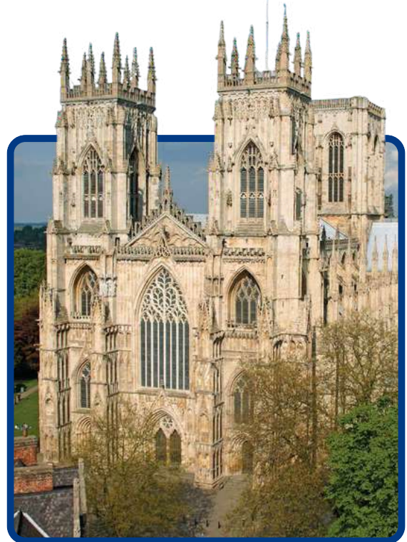
Catedral de Iorque

Após café da manhã, saída para o sul através das ondulantes paisagens de Terras Baixas nos dirigindo a Jedburgh, cena antiga de lutas fronteiriças, onde veremos os restos da ordem beneditina. Nossa rota continua até a histórica cidade de Durham, dominada pela sua magnífica catedral. Tempo livre. Prosseguiremos até York, bela cidade de origem roaman com ampla história ligada aos vikings. Tempo livre para disfrutar de suas ruas encantadoras e poder admirar o exterior da maior catedral do Norte da Europa. Acomodaçãõ.