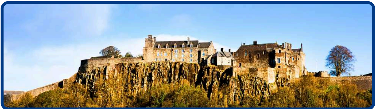
Castelo de Stirling

Após café da manhã, nos dirigimos por paisagens de meia montanha até Pitlochry, onde visitaremos uma destilaria de whisky e teremos a oportunidade de conhecer o centenário método de fabricação de whisky com uma degustação incluída. Continuaremos até Callander e Stirling. A batalha de de Stirling Bridge (conhecida pelo filme Braveheart) de 1297 foi a maior vitória de William Wallace e o converteu em um líder indiscutível da resistência contra os ingleses. Visitaremos ainda o Castelo de Stirling, situado sobre uma rocha oceânica com vistas impressionantes. Tempo livre. Continuação até Edimburgo, onde efetuaremos uma visita panorâmica antes de chegar ao Hotel. Acomodação.