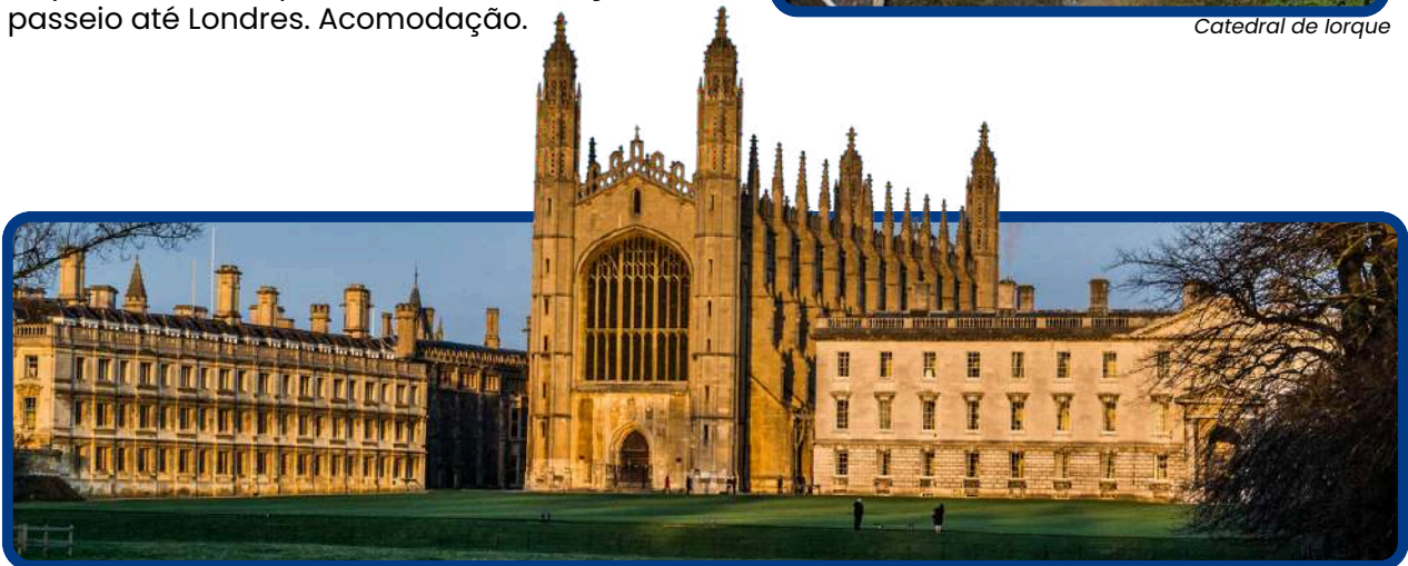
Universidade de Cambridge

Após café da manhã, saída até chegar a encantadora Universidade de Cambridge, que não somente é rival de Oxford em educação e esportes, mas também em beleza e arquitetura. Tempo livre. Continuação do passeio até Londres. Acomodaçãõ.