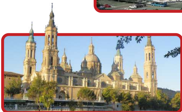
Catedral Basílica de Nossa Senhora del Pilar