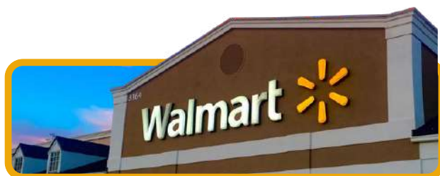
WALMART em Orlando.

Chegada aos EUA. Transporte ao Hotel. Ida ao WALMART. O Walmart é um grande centro de compras onde você encontra de tudo um pouco. Neste dia nossos aventureiros podem comprar lembrancinhas, comida, eletrônicos, maquiagem e muito mais!