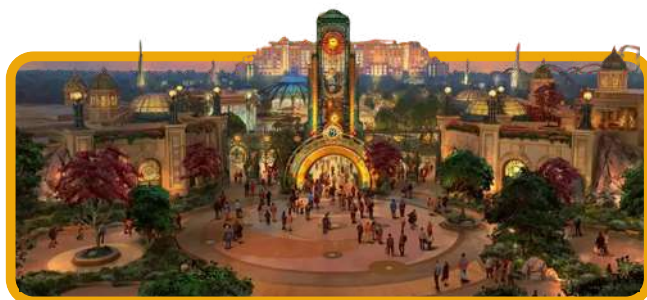
Universal' Epic Universe®

Após o café da manhã, saída para o novo Parque Universal' Epic Universe®. Do Celestial Park ao Super Nintendo World, aventuras de outro mundo te esperam! Este novo parque que será inaugurado no primeiro semestre de 2025, nos levará a aventuras de outro mundo, tais como: Super Nintendo World™ (No Super Nintendo World™, você experimentará uma nova maneira de jogar, desde o desafiador Bowser da atração Mario Kart™ até altas aventuras no Donkey Kong Country™ e muito mais), The Wizarding World of Harry Potter™ – Ministério da Magia™ (De Paris da década de 1920 até o Ministério Britânico da década de 1990, explore comunidades internacionais de bruxaria e a magia que os conecta ao The Wizarding World of Harry Potter - Ministry of Magic), Como Treinar o seu Dragão – Isle of Berk (um espetáculo fantástico te espera), Dark Universe (Dos experimentos da Dra. Victoria Frankenstein a uma paisagem sombria onde monstros perambulam, o Dark Universe é um mundo de mitos e mistérios) e o Celestial Park (Mergulhe em um exuberante mundo verde, onde emoções, entretenimento, restaurantes e lojas levam todos os visitantes a uma emocionante jornada de descobertas).