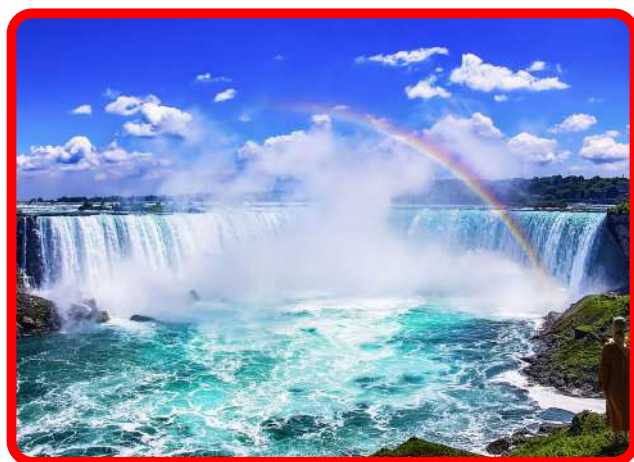
Cataratas do Niagara

Após o café da manhã, saída para as famosas Cataratas do Niagara, onde navegaremos pelo Rio Niagara (passeio de barco pelas cataratas incluso) e que nos levará a caída das Cataratas. Posteriormente, ida ao hotel e acomodação.