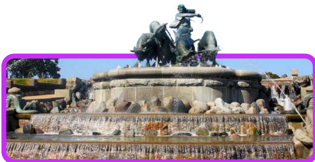
Fonte da Deusa Gefion

Café da manhã e visita panorâmica à cidade, percorrendo seus principais monumentos e lugares históricos como a Praça da Prefeitura, Palácio de Christiansborg (atual sede do Parlamento), Fonte da Deusa Gefion, porto de Nyhavn com suas pitorescas e coloridas casas do século XVII e, claro, o emblema da cidade, a famosa Pequena Sereia. Tarde livre. Acomodação.