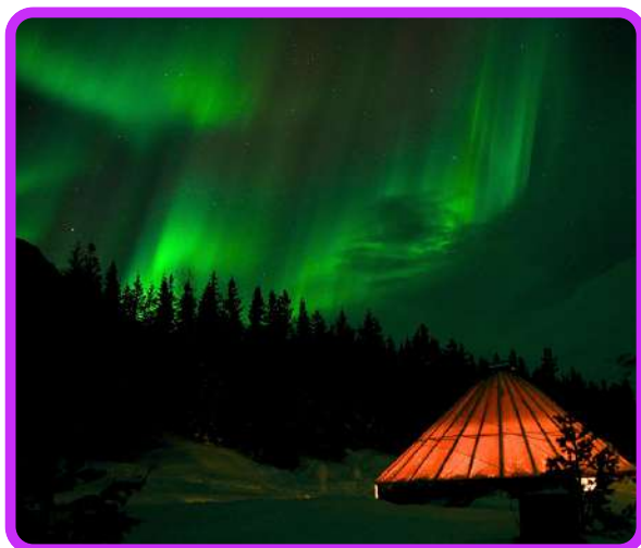
Aurora boreal em Sámi

Café da manhã e vista panorâmica à cidade incluindo visita ao interior da Catedral do Ártico. Em seguida subimos no teleférico Fjellheisen para o Monte Floya, para apreciar avista da cidade e das ilha de fjords circundantes. Retorno ao hotel e tarde livre. À noite, saída para um campo Sámi a 75 minutos da cidade de Tromso. Nesta área encontramos um clima seco e estável com muitos dias de céu limpo. Devido ao clima estável de sua localização, há maiores chances de detectar os frágeis raios da Aurora Boreal. Além disso, nesta área desabitada, nenhuma luz artificial perturbará sua experiência ou seu intento de capturar a Aurora Boreal com sua câmera. Durante a visita será servida uma bebida quente e desfrutamos um momento social junto à lareira do Grande Lavvu (tenda de pastores Sámi). Acomodação em Tromso.