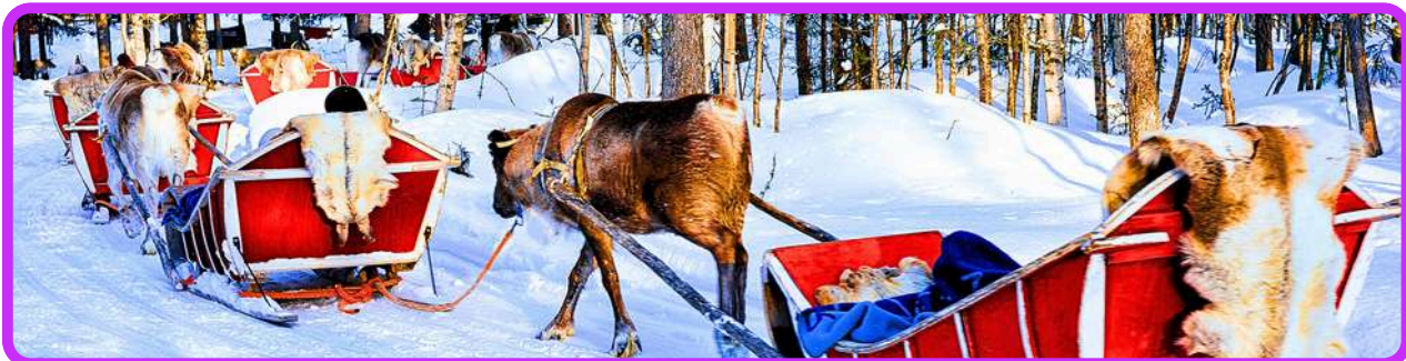
Renas conduzindo trenó em Sámi

Após o café da manhã iremos para um acampamento Sámi. Seguindo os passos da cultura Sámi, você pode desfrutar um passeio em trenó de renas por pitorescas paisagens congeladas. Esta aventura é adequada para pessoas de qualquer idade, pois estarão sentadas e a condução é em pares com um trenó para cada rena. Depois pode-se tentar pegar uma rena com um laço, como fazemos Sámi antes de marcá-las. Concluiremos esta excursão com uma bebida quente. Retorno ao hotel e acomodação.